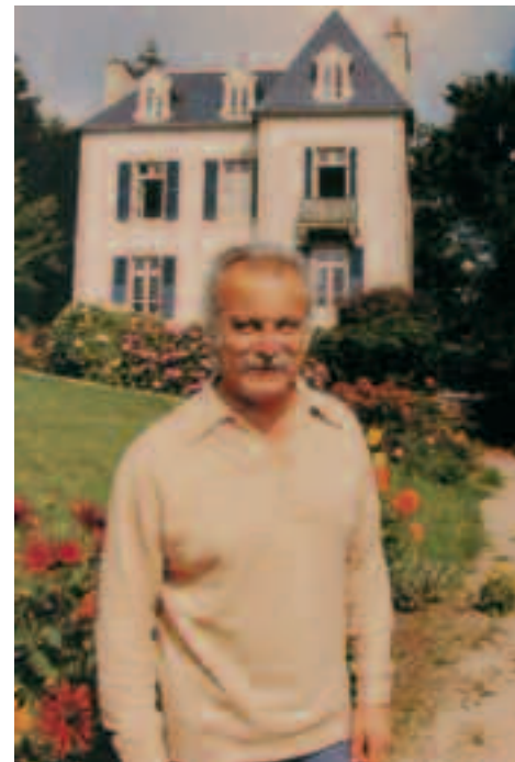
Georges Brassens.