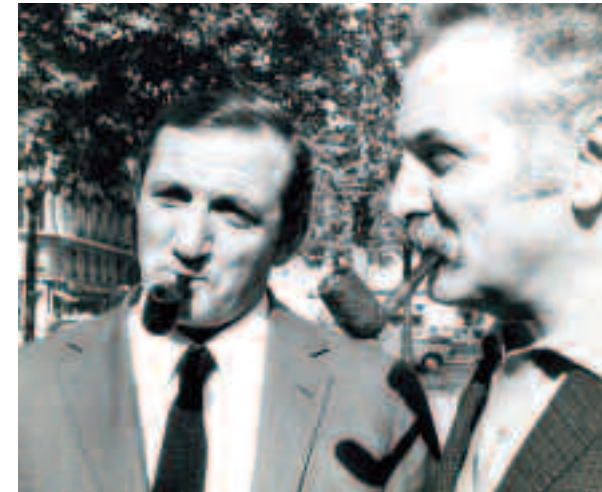
Lino Ventura, Georges Brassens, 1970.