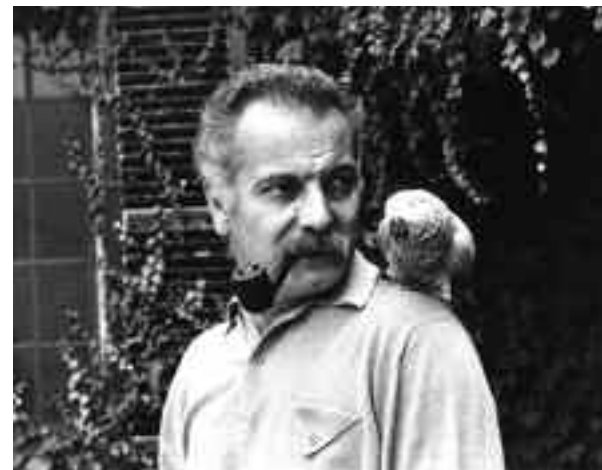
Georges Brassens, Crespières, octobre 1969.