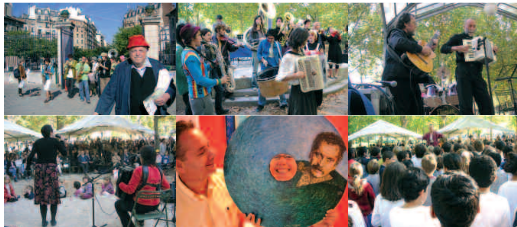
Journées Georges Brassens 2005. Photos X.