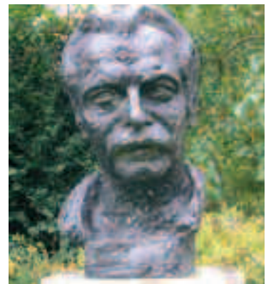
Buste Georges Brassens, Parc Georges Brassens