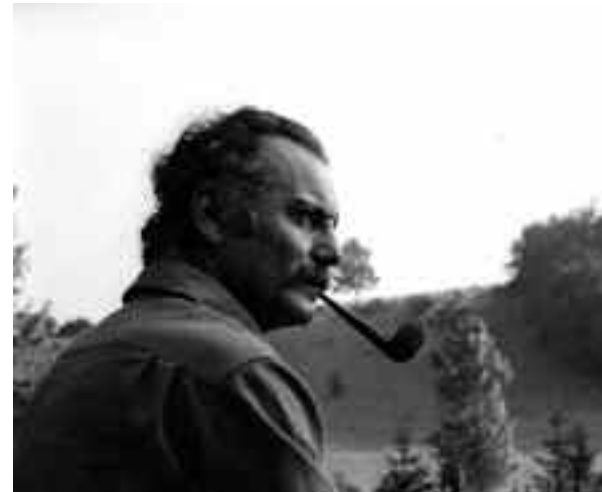
Georges Brassens, Crespières 1960.