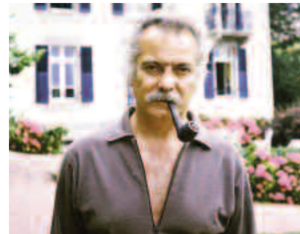
Georges Brassens, Les Lézardrieux, 1972.