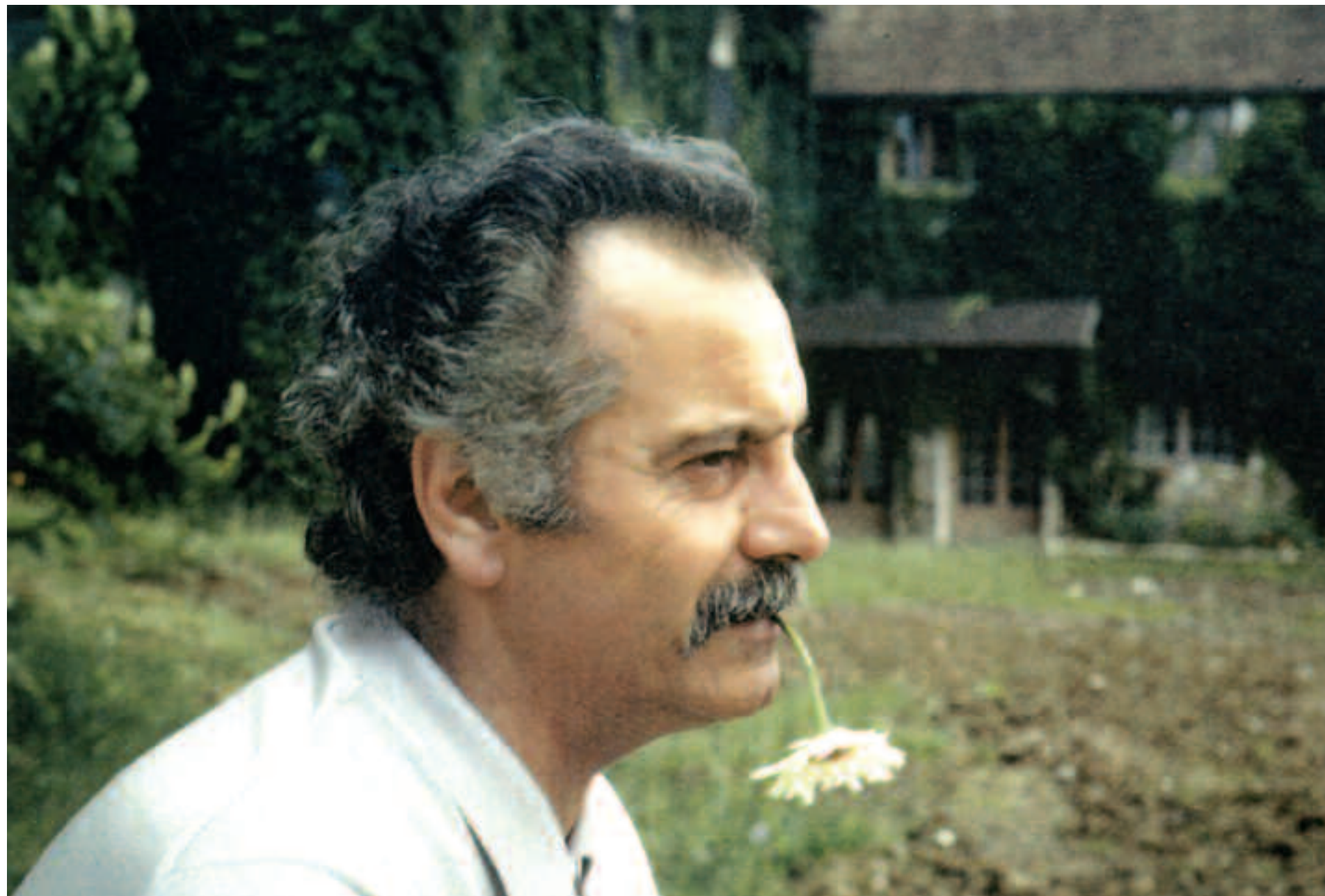
Georges Brassens, Crespières.